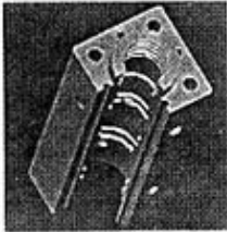
图1 液压锤阀体的三维图